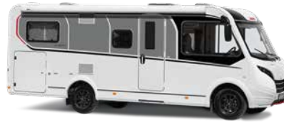
GT (Option. Bestandteil der ACTIVE-Ausstattung)