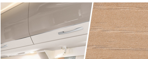
+ Holzdekor Noce Nagano