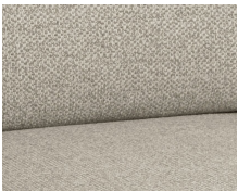
+ Wohnwelt Kari