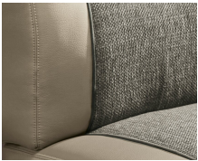
+ Wohnwelt Camino