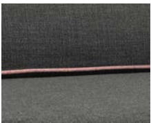
+ Wohnwelt Visby