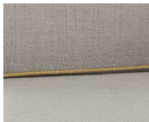
+ Wohnwelt Skagen