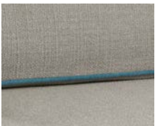
+ Wohnwelt Fyn