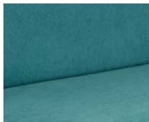
+ Wohnwelt Blue Lagoon ○