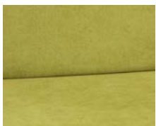
+ Wohnwelt Green Paradise ○