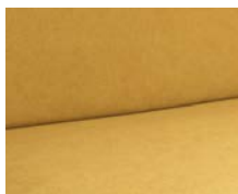
+ Wohnwelt Sunshine ○