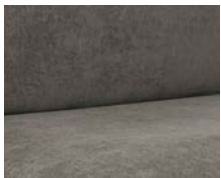
+ Wohnwelt Grey Orbit