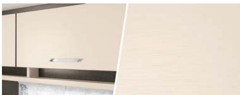
+ Holzdekor Pearlwhite