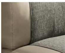
+ Wohnwelt Camino