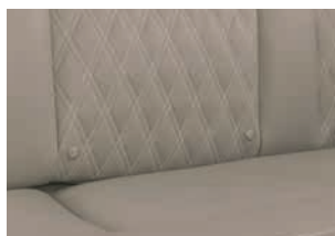
+ Rubino (Echtleder, Option)