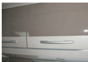
+ Noce Nagano