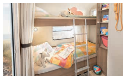
» 2er Stockbett oder optional auch mit einem 3er Stockbett verfügbar (Abweichungen siehe technische Daten)