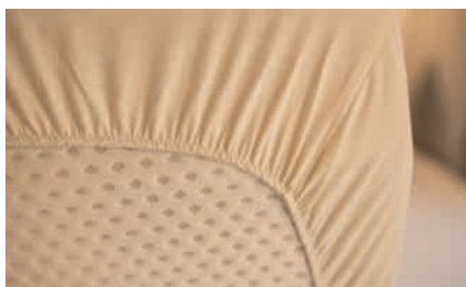
» Kaltschaummatratzen bei allen festen Einzel- und Doppelbetten