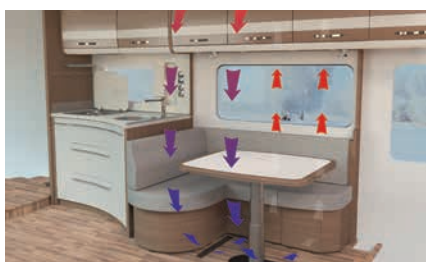
» AirPlus - perfekte Luftzirkulation im Innenraum und Hinterlüftung der Dachschränke und Anrichten