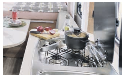
» Praktischer 3-Flamm-Kocher mit manueller Zündung