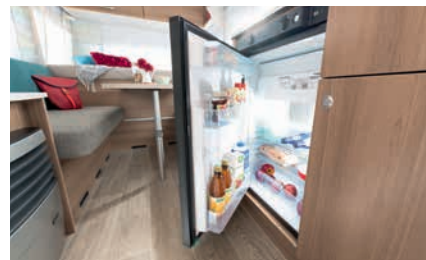
» Geräumiger Kühlschrank mit 81l Volumen und 10l Frosterfach (Abweichungen siehe technische Daten)