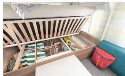
» Speziallattenrost mit flexiblen Kautschukendlagern, aufstellbar zur optimalen Nutzung der Stauräume unter den Betten