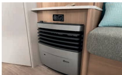
» Leistungsstarke Warmluftheizung