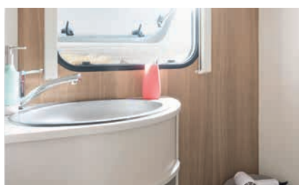
» Formschönes Waschbecken aus Edelstahl