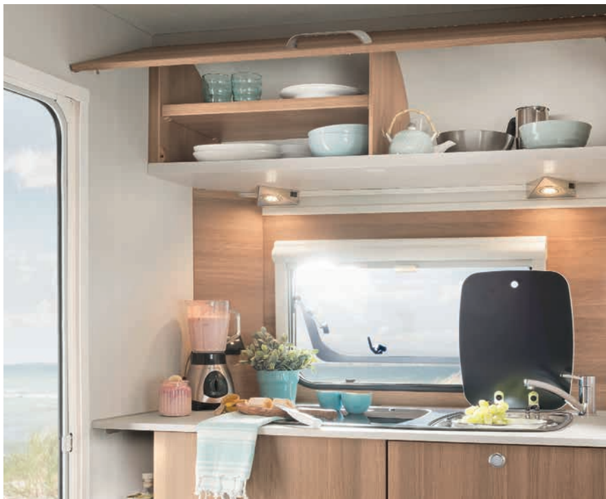
» Geräumige Küchenüberschränke