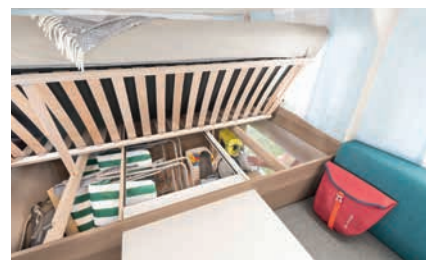
» Speziallattenrost mit flexiblen Kautschukendlagern, aufstellbar zur optimalen Nutzung der Stauräume unter den Betten