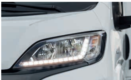
» T: Schickes Sicherheitsfeature: LED-Tagfahrlicht (Option)