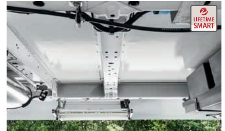
» Holzfreie, verrottungssichere Lifetime-Smart Aufbau­konstruktion (GFK-verkleidet)