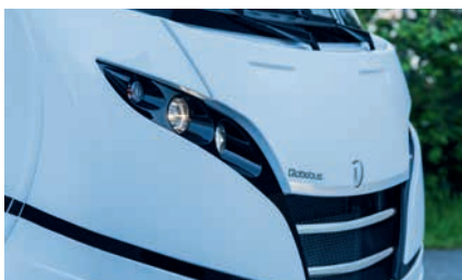
» I: Markante Scheinwerfer, elegant ins Design integriert