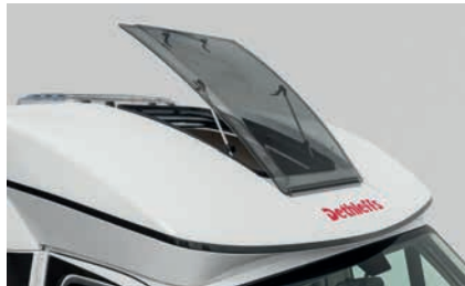
» T: Großes aufstellbares Fenster in der Fahrerhaushaube