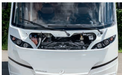
» I: Servicefreundlich: große Motorraumöffnung zur guten Erreichbarkeit aller service-relevanten Teile