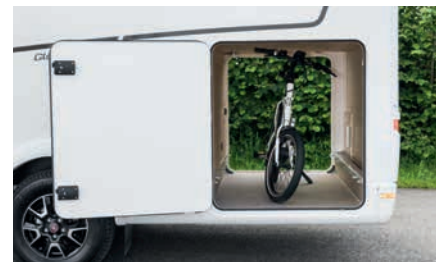
» Hohe, beidseitig beladbare Heckgarage mit 150 kg Flächenlast