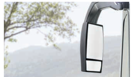
» I: Doppelspiegel für ein optimales Blickfeld