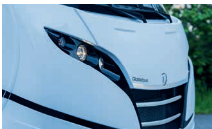
» I: Markante Scheinwerfer, elegant ins Design integriert