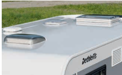
» Gut geschützt vor Hagel: widerstandsfähiges GFK-Dach