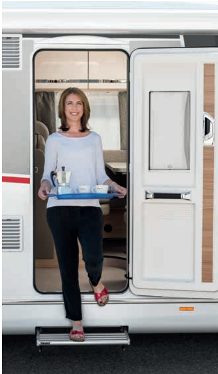
» 70 cm breite Aufbau-türe (außer T / I 1) mit Fliegengitter-Jalousie