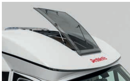
» T: Großes aufstellbares Fenster in der Fahrerhaushaube