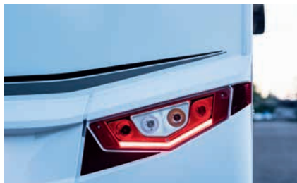
» T / I: Markant und sicher: Integral-Rückleuchten mit LED-Nachtfahrlicht