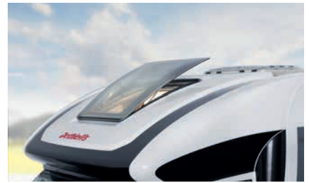
» Formschöne Konstruktion der Hauben der Teilintegrierten (Option)