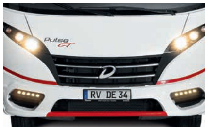
» Neues Integrierten Familiengesicht (Abb. optionales GT-Paket)