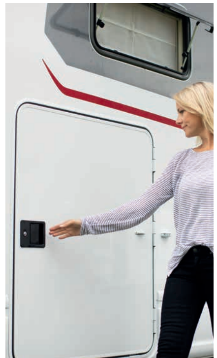
» Praktische Bedienung der Heckgaragen mit einer Hand