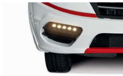
» Sieht schön aus und ist sicher: das Tagfahrlicht (Option)