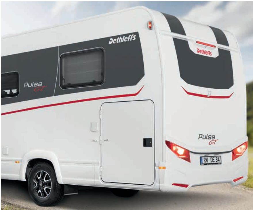
» Fließende Dachlinie zum aerodynamisch gerundeten Heck