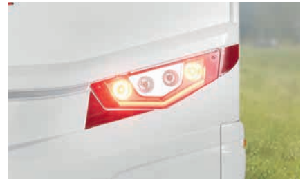
» Formschön gestaltetes Heck mit LED-Rückleuchte