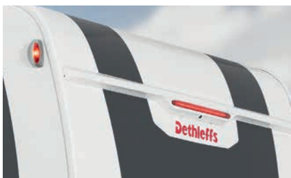
» Elegant integrierte Rückfahrkamera (optional) in den Spoiler darüber die extra große 3. Bremsleuchte