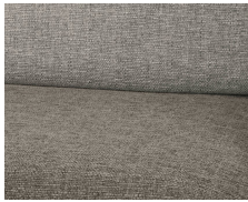
+ Wohnwelt Portobello *