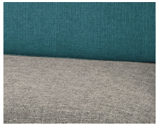
+ Wohnwelt Clipper