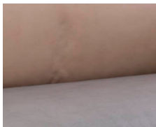
+ Wohnwelt Duke *