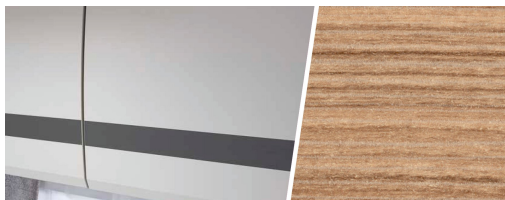
+ Holzdekor Rosario Cherry