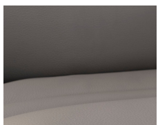
+ Echtleder- Wohnwelt Collin *