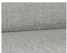
+ Wohnwelt Samir