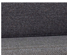
+ Wohnwelt Melia *