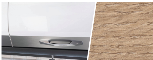
+ Holzdekor Amberes Oak