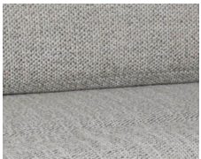
+ Wohnwelt Samir