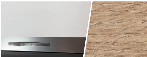
+ Holzdekor Amberes Oak