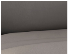
+ Echtleder- Wohnwelt Collin *