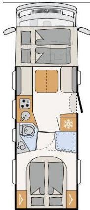
I 7150-2 DBL