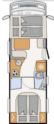
I 7150-2 DBM