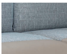
+ Stoffkombinasjon Cosmopolitan