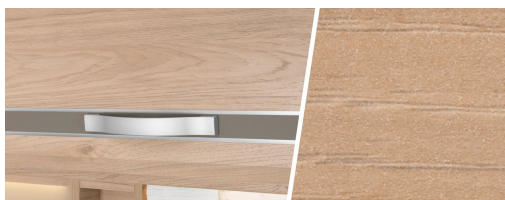
+ Tredekor Noce Nagano